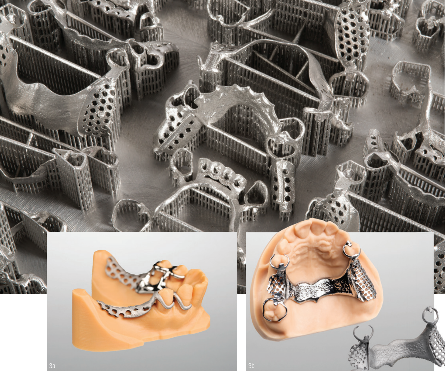
Abb. 1: exocad PartialCAD Design eines UK-Modellguss. Abb. 2: Modellgussprothesen auf Bauplattform. Abb. 3a: Modellgussprothese (UK) auf gedrucktem Modell. Abb. 3b: Modellgussprothese (OK), hochglänzend (links) und basis (rechts).

der Modellguss auch bereits industriell vorgefertigt angeliefert werden. Nach erfolgreicher Anprobe kann im Labor mit der Aufstellung und Finalisierung im gewohnten Prozess begonnen werden.